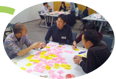
最後はお互いに フィードバック