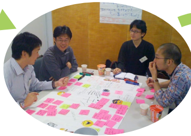
ワールド・カフェスタート★