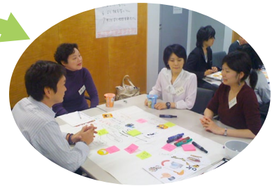
メンバーは シヤツフル・シヤツフル！