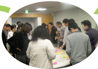
参加者全員で フィードバック