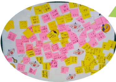
たくさん意見が 出てきた！